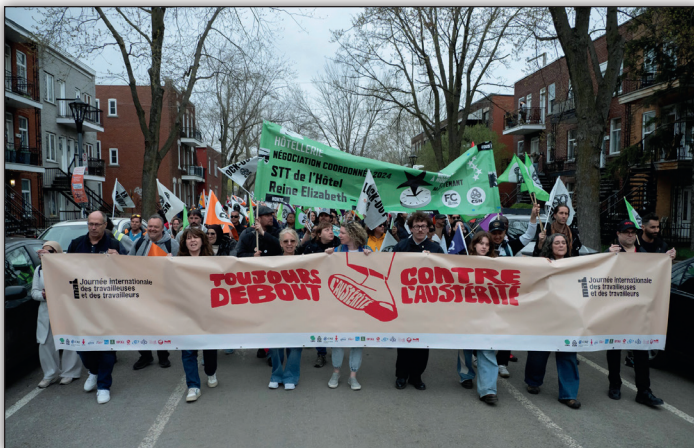
1 er mai 2025

Les syndicats comme le SEOM participent dorénavant à la Journée internationale des travailleuses et des travailleurs, non pas pour célébrer le travail, mais pour poursuivre les luttes sociales, défendre les droits des travailleurs et préserver les acquis sociaux. C'est pourquoi nous vous invitons à rejoindre la marche nationale de la Journée internationale des travailleuses et des travailleurs qui se tiendra à Montréal le samedi 2 mai 2026.