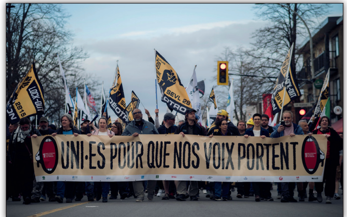
1 er mai 2024

Rédaction : La FAE, Sarah Brabant, Sophie Milot, Dominique Prenoveau et Geneviève Rousseau