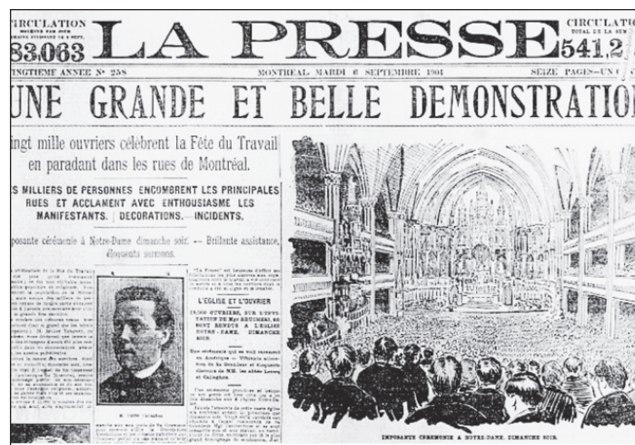
Messe célébrée à la basilique Notre-Dame en l'honneur de la fête du Travail, le 4 septembre 1904.

dans un contexte croissant d'industrialisation et d'organisation syndicale.